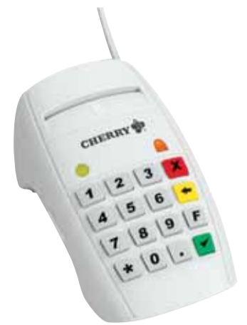
▲ Cherry MKT+ Terminal ST-2052

Problematisch gestaltet sich auch der Aufbau einer Netzwerkinfrastruktur zum Aufschalten der Terminals. Hier hoffen wir auf Lösungen durch die Terminalhersteller. Durch Verwendung von Miniswitches in den Terminals könnte der Portmangel dezentral entkräftet werden. Eleganter scheint